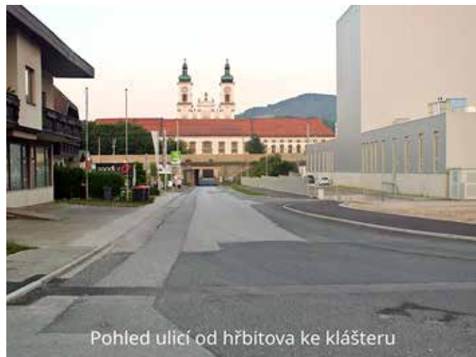
Pohled ulicí od hřbitova ke klášteru

Místní hřbitov se na nynějším místě nachází od roku 1720. Zajímavý je už svou polohou; je umístěn naproti klášternímu