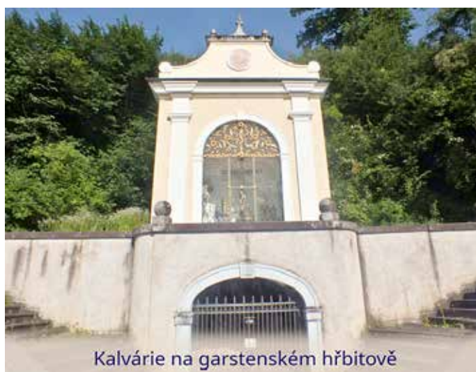
Kalvárie na garstenském hřbitově

areálu a původně souměrný podle téže osy. Pozdější rozšíření symetrii částečně narušilo, ale původní část je nadále patrná. Nad jeho (zhruba) západní stranou se tyčí barokní kaple s výjevem Kalvárie. V jejím podnoží najdeme nízký klenutý prostor, v němž vidíme tři postavy mezi plameny – zjevně zpodobnění pekla inspirované oním »sestupil do pekel« z Apoštolského vyznání víry. Ale to nejzajímavější nakonec: před celým výjevem najdeme papír s nápisem: »Im Gedenken an die verstorbenen Kameraden der Freiwilligen Feuerwehr Garsten.« tj. »Na památku zesnulých kolegů z Dobrovolného hasičského sboru Garsten«. Takové umístění tohoto nápisu svádí k myšlence, že garstenští hasiči posílají zesnulé kolegy do pekla, aby uhasili jeho plameny, a tím završili Ježíšovo