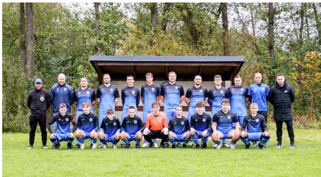
Mužstvo B-týmu TJ Prostřední Lhota.

důvodu, že nám postupně vyrůstají děti a mládež ze svých kategorií a my jsme najednou stáli před problémem, jak udržet silné ročníky 2008 a 2009 ve Lhotě. Navíc se nám povedlo přesvědčit některé kluky z ročníku 2006 (kteří u nás v minulosti hráli) k návratu z jejich současných klubů zpět do Lhoty. Mužstvo jsme doplnili ročníkem 2010 a najednou jsme měli dost hráčů, abychom mohli soutěž dorostu v klidu odehrát. Bohužel