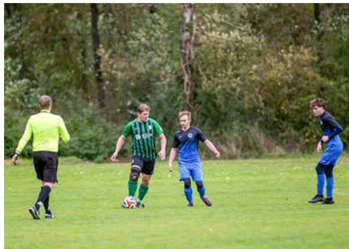
Momentka ze zápasu s TJ Krásná Hora.

Kapacita sportovního areálu v Prostřední Lhotě není nafukovací. Při současném množství hráčských kategorií (fotbalová školička, mladší příprava, starší příprava, mladší žáci, starší žáci, B-tým, A tým) je vždy problém, jak se na jediné travnaté hřiště vejít. B-tým má tréninkové dny středa a pátek. V závislosti na počasí využíváme i travnaté hřiště v Čími anebo hřiště s umělým povrchem v Prostřední Lhotě a Cho-