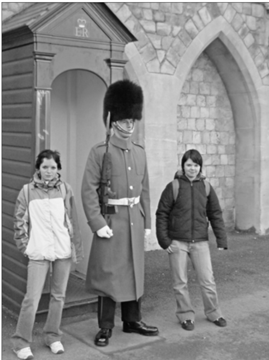
Stráž na Windsdor Castle